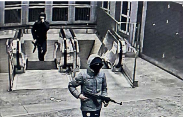
▲ Schutters uit het drugmilieu wandelen ongestoord met een kalasjnikov door het metrostation Clemenceau in Anderlecht.

De voorbije maanden haalde Brussel bijna dagelijks het nieuws met berichten over gewelddadige criminaliteit. Beelden van gewapende criminelen die openlijk schieten in de straten zijn helaas geen uitzondering meer. Voor het Vlaams Belang is het duidelijk: de hoofdstad is totaal ontspoord. "Veel Brusselaars voelen zich niet langer veilig in hun eigen buurt" , stelt De Brabandere. "Jarenlang werd onze partij weggezet als 'Brusselhater' omdat wij de problemen wél durfden benoemen. Maar de échte Brusselhaters zijn zij die deze situatie hebben laten escaleren."