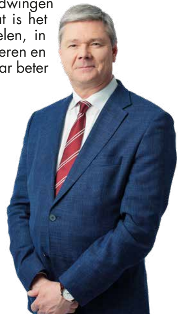
Dominiek Lootens-Stael Vlaams Parlementslid

Brussel zal alleen uit het financiële moeras kunnen komen als het de nodige structurele hervormingen doorvoert en komaf maakt met het cliëntelisme en de geldverspilling die ermee gepaard gaat. Druk uitoefenen vanuit Vlaanderen om de dominante Brusselse politieke klasse te dwingen haar beleid te veranderen, dat is het pad dat we moeten bewandelen, in het belang van Brussel, Vlaanderen en de Vlamingen. Iedereen zal daar beter van worden.