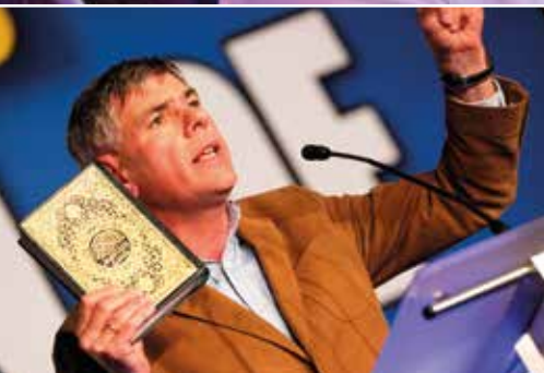
Filip Dewinter: “Er komt helemaal geen Europese islam, er komt alleen een geïslamiseerd Europa”