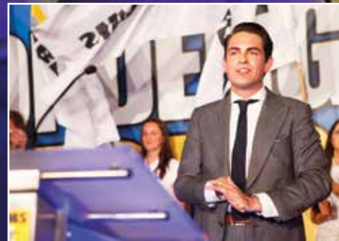
Tom Van Grieken: “Als deze regering 1,5 miljard kan vinden om asielzoekers op te vangen, dan kan ze ook centen vinden om criminele vreemdelingen het land uit te zetten.”