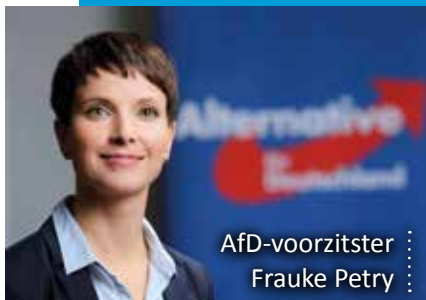
AfD-voorzitster : Frauke Petry :

In de herfst van 2013 nam de partij meteen deel aan de Duitse Bondsdagverkiezingen. Ze bleef met 4,7% van de stemmen net onder de kiesdrempel, waardoor tot op heden AfD geen verkozenen heeft in het nationale parlement. Maar het was duidelijk dat het prille zaad in vruchtbare aarde viel. Bij drie deelstaatverkiezingen haalde de partij in 2014 meteen 10 tot 12%. In mei 2014 trok de AfD onder leiding van medevoorzitter Bernd Lucke met 7 verkozenen naar het Europees parlement. Het voorzitterschap van de partij werd tot juli 2015 gedeeld door Bernd Lucke (ook één van de oprichters), Frauke Petry (foto) en Konrad Adam.