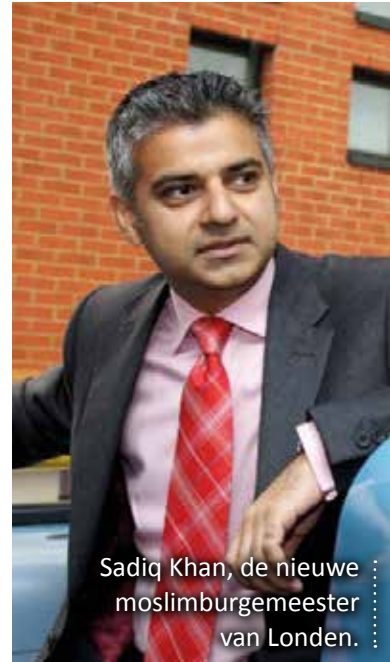
Sadiq Khan, de nieuwe moslimburgemeester van Londen.