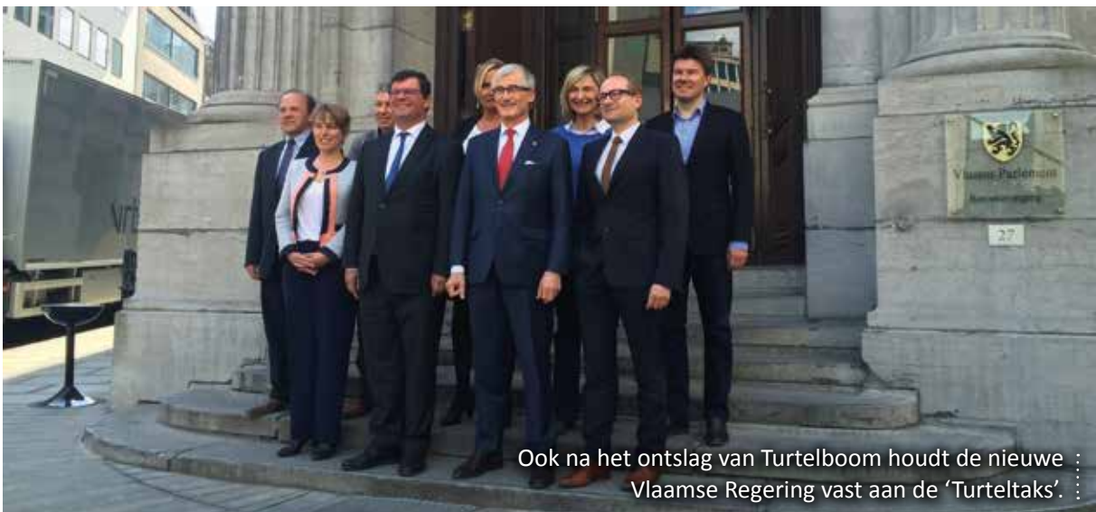
Ook na het ontslag van Turtelboom houdt de nieuwe Vlaamse Regering vast aan de ‘Turteltaks’.