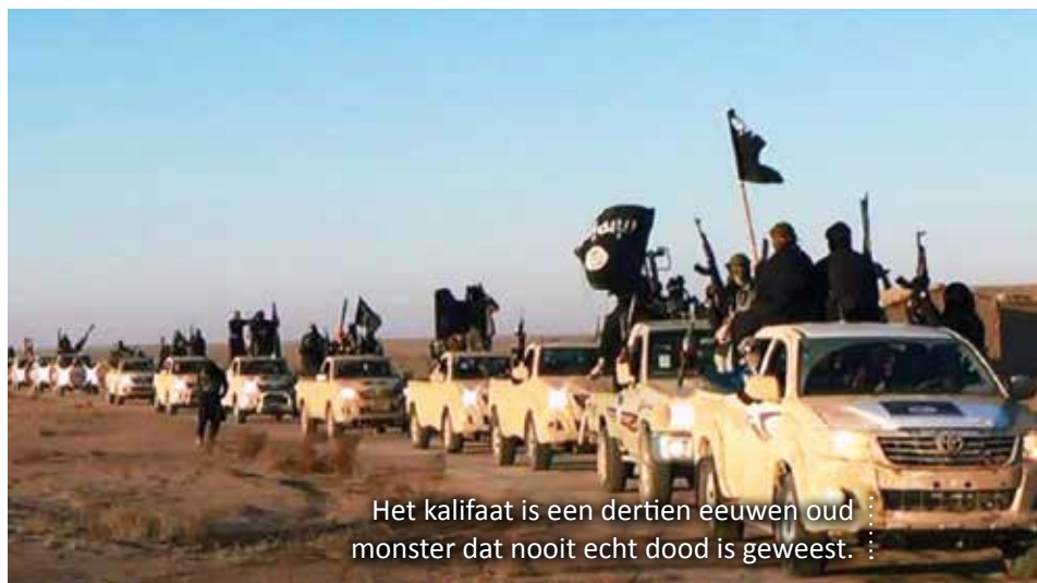
Het kalifaat is een dertien eeuwen oud monster dat nooit echt dood is geweest.