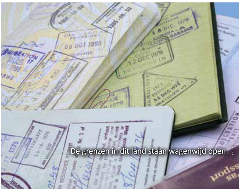
De grenzen in dit land staan wagenwijd open. ...