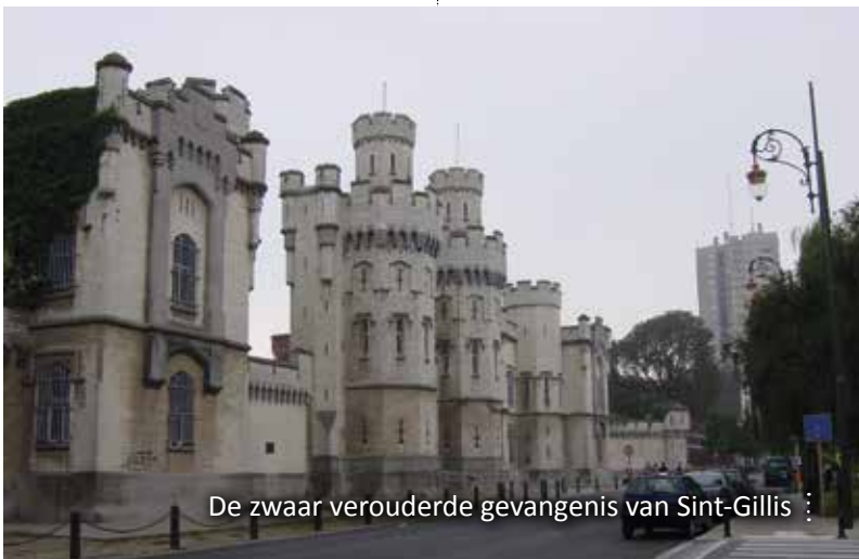
De zwaar verouderde gevangenis van Sint-Gillis

Nadat eerder aan het licht kwam dat het luchtvaartpersoneel heel wat jihadistische elementen telt, raakt nu bekend dat ook het Belgisch leger tal van moslimextremisten in zijn rangen heeft. Zo'n 60 radicale moslims die in het Belgische leger dienen, worden 'in de gaten gehouden' door de inlichtingendiensten. Het gaat om 55 soldaten en vijf