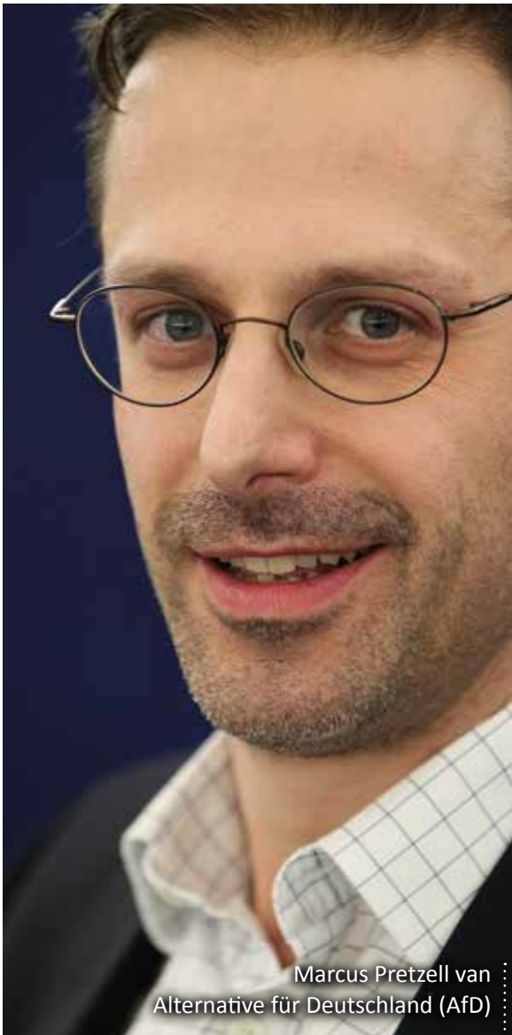
Marcus Pretzell van Alternative für Deutschland (AfD)

Met Marcus Pretzell van Alternative für Deutschland (AfD), heeft onze Europese fractie ‘Europa van Naties en Vrijheid’ (ENV) er sinds kort een nieuw parlamentslid bij. Deze jonge partij heeft in Duitsland en de rest van Europa de afgelopen tijd al behoorlijk wat stof doen opwaaien. Vlaams Belang magazine interviewde de man om meer te weten te komen over dit fenomeen.