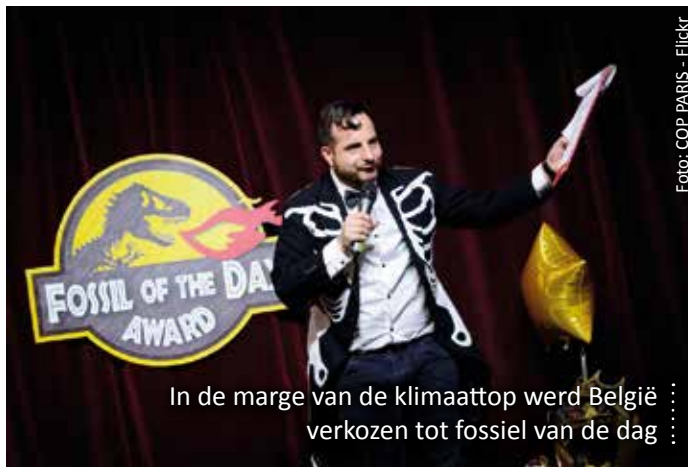
In de marge van de klimaatop werd België verkozen tot fossiel van de dag

Hoe ijstijden beginnen, weten we niet juist, maar van klimaatconferenties weten we het wel: door een onheilige alliantie van lobby's en drukingsgroepen. Socialisten die de strijd tegen de klimaatverandering willen gebruiken om de