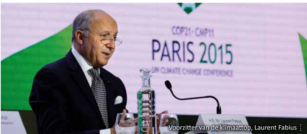
Voorzitter van de klimaatop, Laurent Fabius