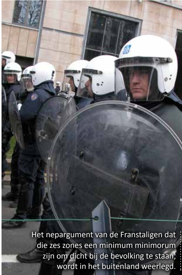
Het nepargument van de Franstaligen dat die zes zones een minimum minimorum zijn om dicht bij de bevolking te staan, wordt in het buitenland weerlegd.

Natuurlijk is het de Franstaligen daar niet om te doen. De 19 Brusselse burgemeesters staan gewoon niet te springen om bevoegdheden en macht af te staan. Bovendien willen de francofone partijen zo weinig mogelijk inspraak van Vlamingen in het beleid. Op het gemeentelijke niveau is die inspraak tot quasi nihil herleid, maar op het gewestelijke niveau is er een wette-