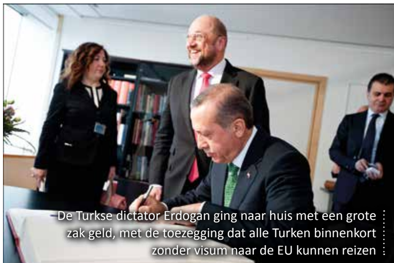
De Turkse dictator Erdogan ging naar huis met een grote zak geld, met de toezegging dat alle Turken binnenkort zonder visum naar de EU kunnen reizen

En dan is er nog een vervelend detail: die drie miljard euro. Volgens de Turken is dat een bedrag dat jaarlijks moet betaald worden.