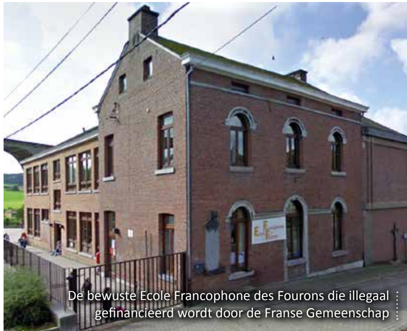
De bewuste Ecole Francophone des Fourons die illegaal gefinancierd wordt door de Franse Gemeenschap

In het Henegouwse Komen, thans een Waalse taalgrensgemeente met faciliteiten voor Nederlandstaligen, werd begin jaren '80 van de vorige eeuw met de steun van het Nederlandstalige Rijksonderwijs met een eigen schooltje begonnen, nadat de Vlaamse faciliteitenschool ingevolge fel protest van lokale Wallinganten werd gesloten. Sedert de Franstaligen de geldkraan dichtdraaiden, telt de Vlaamse Gemeenschap jaarlijks zowat een half miljoen euro neer voor het honderdtal leerlingen van de 'Taalkoffer', die thans deel uitmaakt van het Vlaams Gemeenschapsonderwijs. In 2007 probeerden de ouders nog een keer een subsidieaanvraag in te dienen bij de gemeente Komen en de Franse Gemeenschap, maar daar kwam nooit een antwoord op. "Principieel is deze situatie een beetje ongemakkelijk", zegde onderwijsminister Crevits daarover in het Vlaams Parlement.