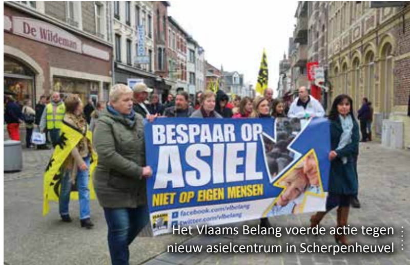
Het Vlaams Belang voerde actie tegen : nieuw asielcentrum in Scherpenheuvel :

In CD&V-kringen werd alvast schuimbekkend gereageerd op weigerachtige gemeentebesturen. Zo stelde CD&V-Kamerlid Franky Demon dat de boetes hoog genoeg