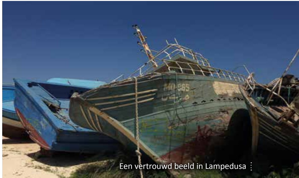
Een vertrouwd beeld in Lampedusa

Het plan getuigde tegelijk van een verbijsterende wereldvreemdheid wanneer het stelde dat het ging