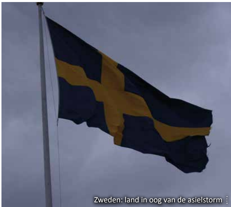
Zweden: land in oog van de asielstorm