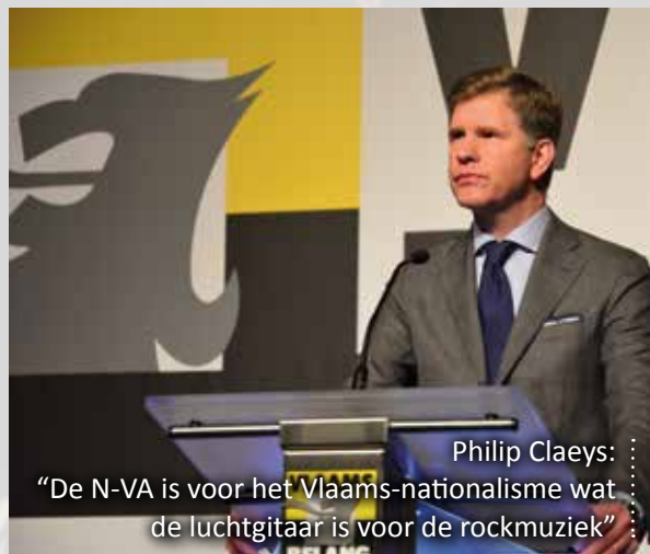
Philip Claeys: “De N-VA is voor het Vlaams-nationalisme wat de luchtgitaar is voor de rockmuziek”