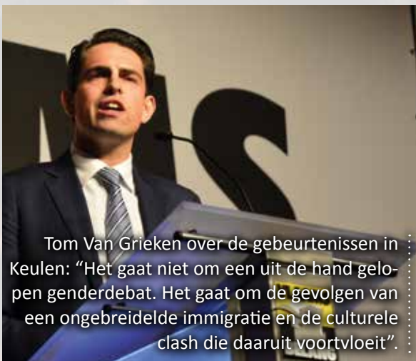
Tom Van Grieken over de gebeurtenissen in Keulen: “Het gaat niet om een uit de hand gelopen genderdebat. Het gaat om de gevolgen van een ongebreidelde immigratie en de culturele clash die daaruit voortvloeit” .