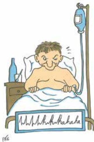
VLAMSE PATIËNTEN WORDEN IN BRUSSEL UITGELACHEN

se, Russische, Albanese, Rwandese, Poolse, standaard-Arabische, Marokkaans-Arabische en Turkse patiënten. In eerste instantie moeten die bemiddelaars de gesprekken met patiënten vergemakkelijken en de wereld van de patiënt uitleggen aan de dokter en vice-versa. De bemiddelaars helpen de anderstalige patiënt ook bij het invullen van documenten, het bieden van emotionele ondersteuning, het bemiddelen in conflicten. Ze geven voorlichting en signaleren knelpunten. De coördinator interculturele bemiddeling binnen het ziekenhuis inventariseert de drempels die de toegang en de behandeling van patiënten met een andere taal of cultuur belemmeren. Wat een verschil met de handelswijze die Vlamingen te beurt valt, want vooralsnog blijft voor hen bij het aloude “pour les Flamands la même chose”.