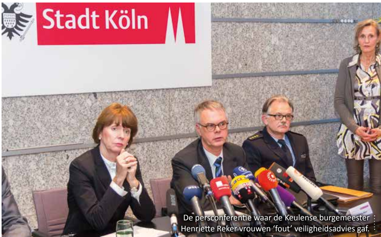
De persconferentie waar de Keulense burgemeester Henriette Reker vrouwen ‘fout’ veiligheidsadvies gaf.